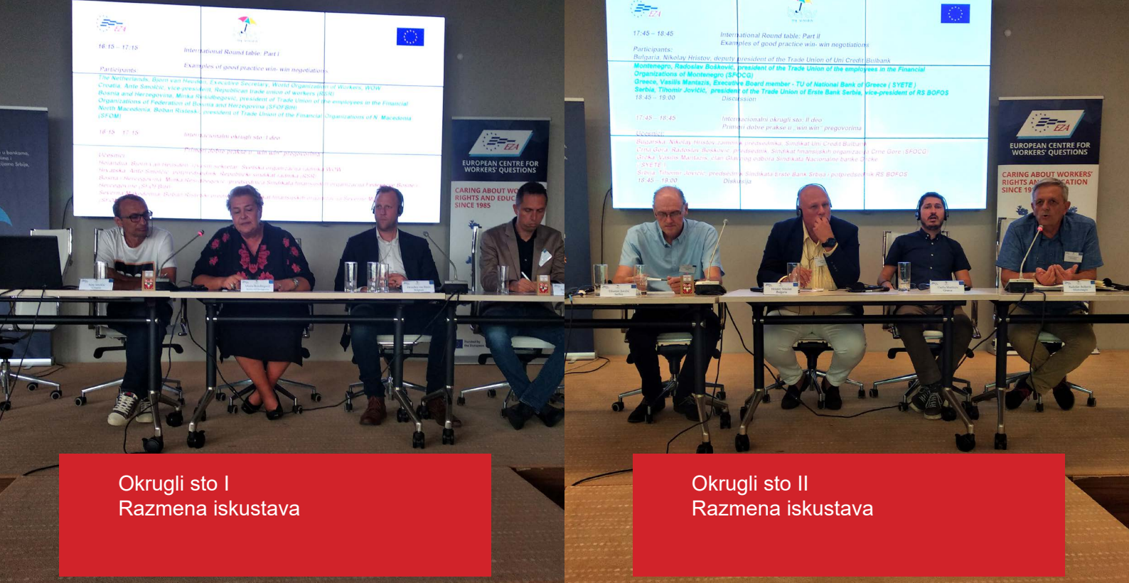
Okrugli sto I Razmena iskustava